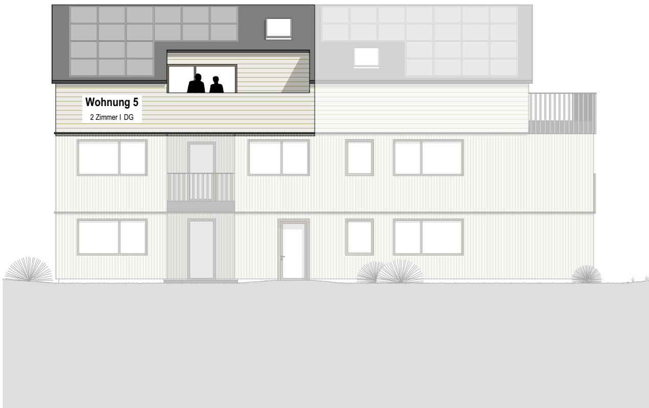
Wohnung 5 2 Zimmer | DG